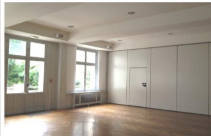
SALLE LUXEMBOURG, Espace BABYLONE

La formation se déroulera aux deux adresses ci-après selon la disponibilité (voir programme détaillé) :