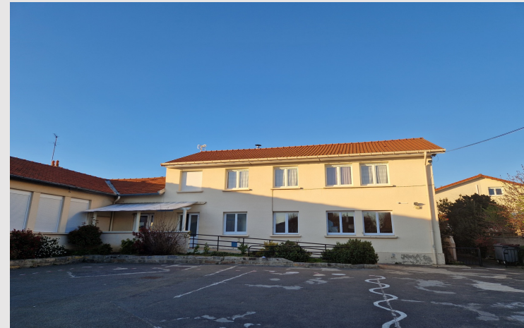
HALL de l'Ecole Plurivalente, 7 rue du Dr Schweitzer, 95600, Eaubonne